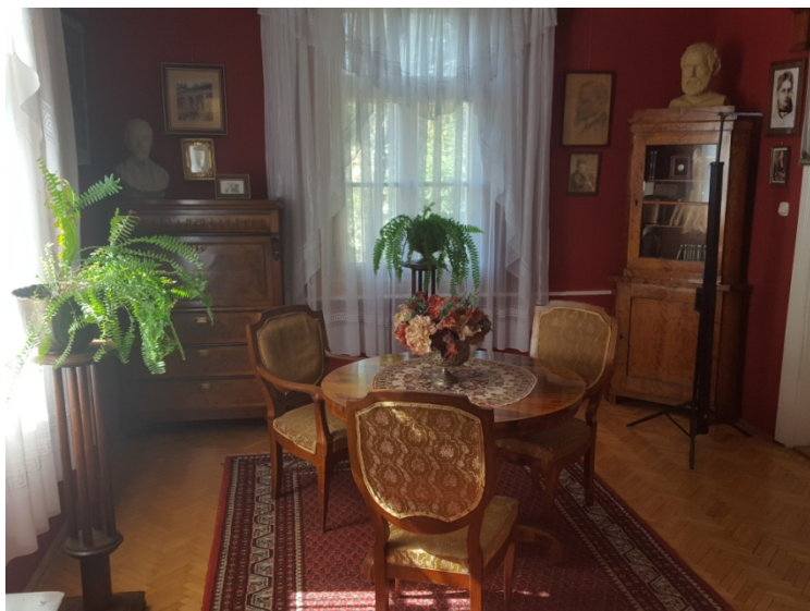
Salonik w Muzeum H. Sienkiewicza