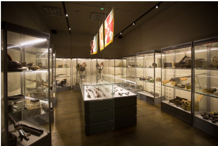
Zbrojownia w Muzeum