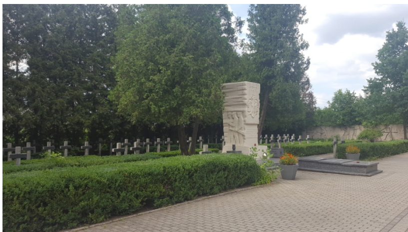
Cmentarz wojenny w Kocku

terenie Kocka. Po wojnie powstał Komitet Opieki nad Cmentarzem, który w latach 1944-49 zajął się jego uporządkowaniem. W roku 1952 dotychczasowe drewniane krzyże wymieniono na cementowe. W 1969 r. wykonano pomnik płaskorzeźbę, zaś w 1989 r. - brązowe tablice z nazwiskami poległych.