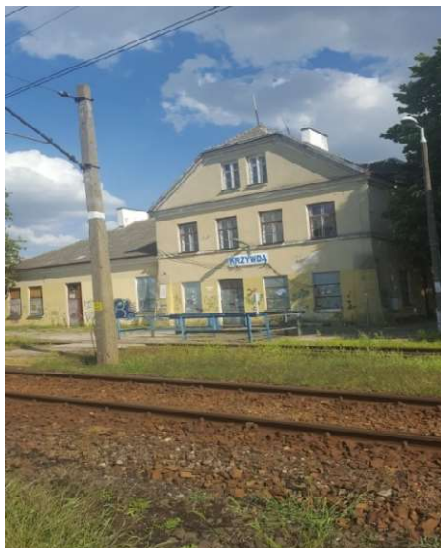
Stacja kolejowa w Krzywdzie (stan obecny)