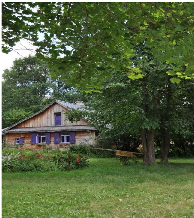
Dwór w Turzystwie - stan obecny (aktualnie posesja wraz z młynem stanowi własność prywatną)