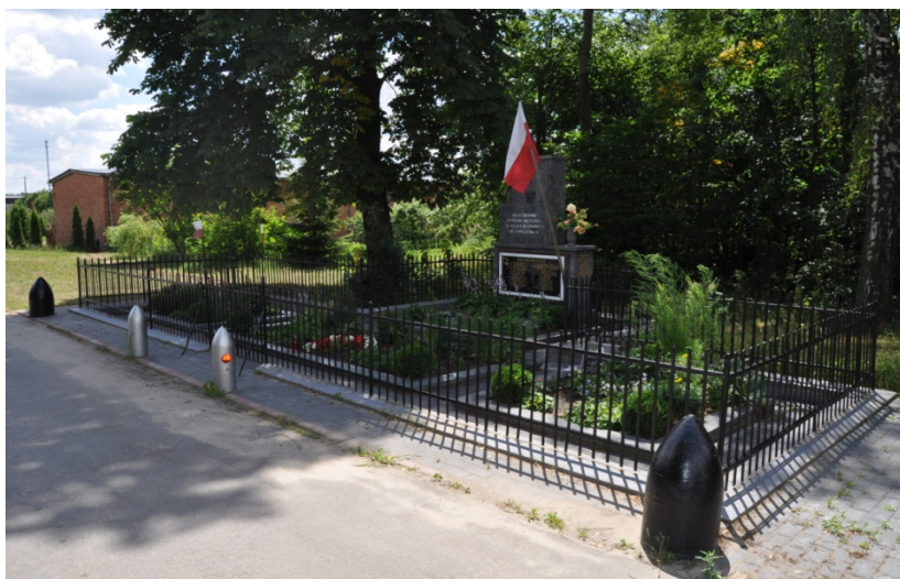
Cmentarz poległych w Helenowie

Jest tu pochowanych 28 żołnierzy SGO Polesie, głównie z Flotyli Pińskiej. We wrześniu 1939 r. nastąpiła reorganizacja batalionów marynarskich. Marynarze z Flotyli weszli w skład 182 Pułku Piechoty z 60 Dywizji Piechoty, jako 3 batalion „morski”. Po zaciętej walce 5 października polskim oddziałom udało się zdobyć wieś. Od 1940 r. na mogile zmieniały się 3 tablice, ostatnią w 2014 r. ufundował Związek Piłsudczyków RP.