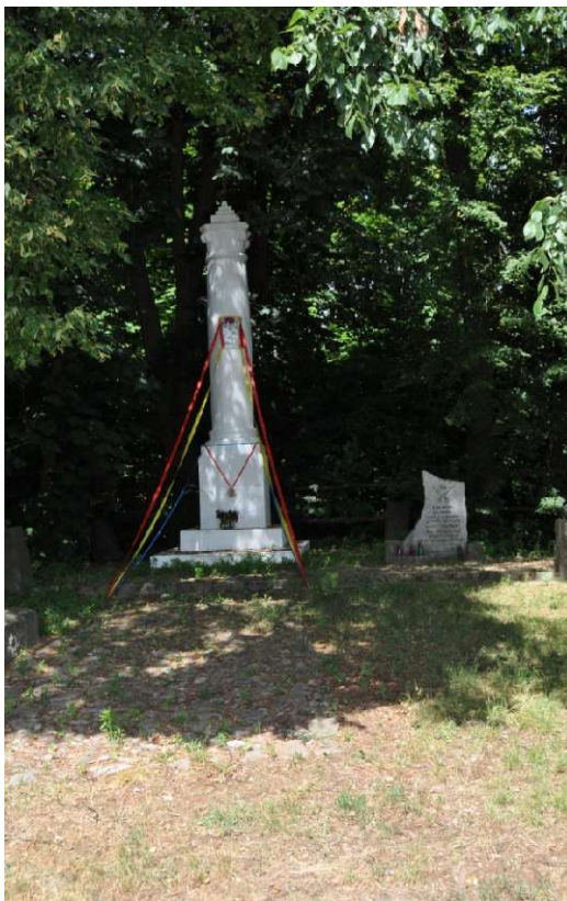
Pomnik przed dworem w Turzystwie

się tam rozegrały. Na monument składają się kapliczka oraz tablica ufundowana w 2001 r.