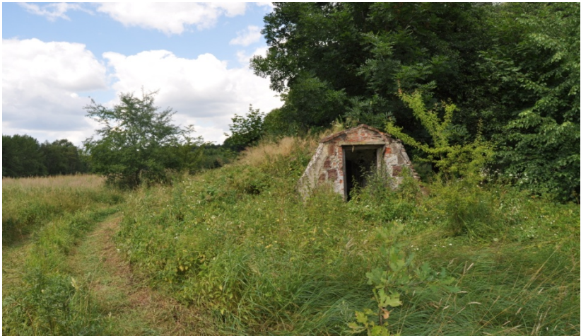
Ruiny leśniczówki Ofiara