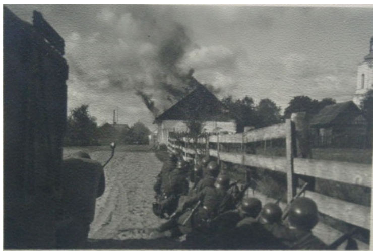
Atak Niemców na Wolę Gułowską 24 września 1939 r. 49

W powszechnej świadomości Wola Gułowska kojarzona jest z Sanktuarium Matki Bożej oraz ostatnią bitwą kampanii polskiej 1939 r. Zdecydowanie mniej osób jednak wie o wydarzeniach, które miały tutaj miejsce kilka dni przed walkami wojsk generała Kleeberga, a w których bardzo ucierpiała miejscowa ludność.