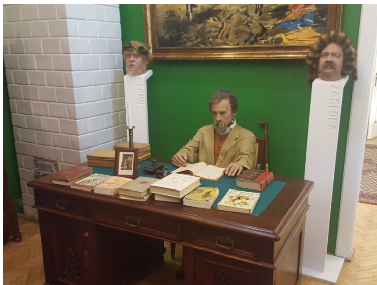
Figura woskowa Henryka Sienkiewicza w Muzeum w Woli Okrzejskiej

1975 roku było ono oddziałem Muzeum Regionalnego w Łukowie, później funkcjonowało jako placówka samodzielna. Muzeum posiada bogaty zbiór fotografii rodzinnych pisarza i dzieła malarskie autorstwa uznanych artystów, obrazujące postać Henryka Sienkiewicza, jak i postacie bohaterów jego utworów literackich. Zgromadzono też bogaty i unikalny księgozbiór zawierający wszystkie pierwsze wydania powieści pisarza oraz tłumaczenia na kilkadziesiąt języków świata, w tym na języki japoński, chiński, arabski, armeński oraz wiele języków europejskich.