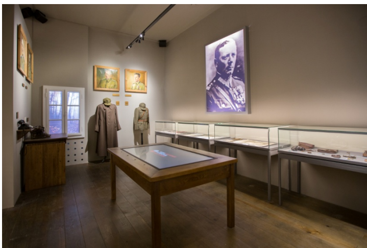
Sala sztabowa Muzeum w Woli Gułowskiej - po prawej portret generała Kleberga