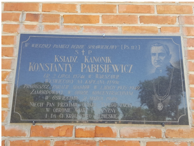
Tablica ku czci ks. Konstantego Pabisiewicza