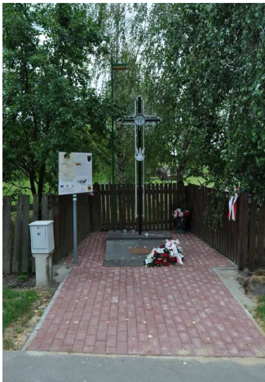
Pomnik poświęcony ostatnim poległym żołnierzom w kampanii 1939 r.