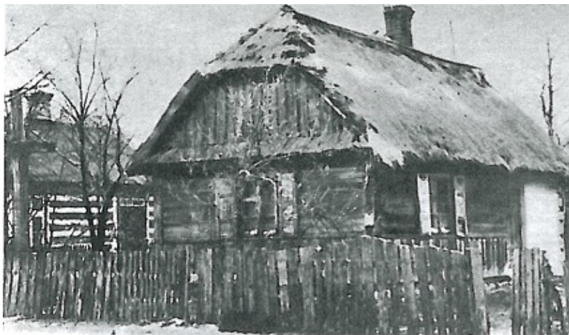
Chata, w której generał Kleeberg wydał ostatni rozkaz 44