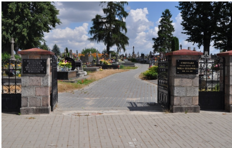
Brama Główna cmentarza

m.in. na terenie Woli Gułowskiej, Turzystwa, Lipin oraz lasu gułowskiego. Cmentarz podczas bitwy był silnym punktem oporu i kilkakrotnie przechodził z rąk do rąk. Jest on największym miejscem pochówku żołnierzy generała Kleeberga, areną corocznych uroczystości patriotycznych.