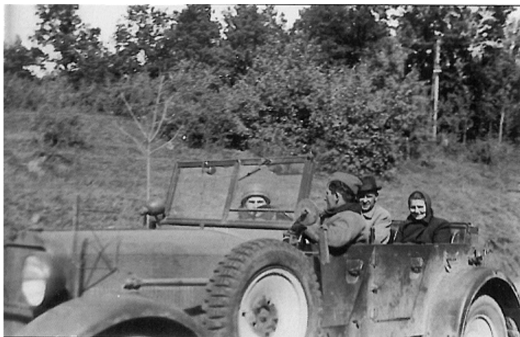
Niemiecy koloniści z Józefowa z żołnierzami Wehrmachtu 51

że działania Niemców spowodowały wycofanie Polaków do Woli Gułowskiej, miejscowość ta znalazła się w centrum działań obu stron. 50