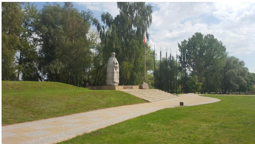
Pomnik generała Kleeberga w Kocku