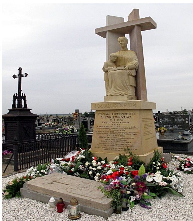
Grób matki H. Sienkiewicza w Okrzei