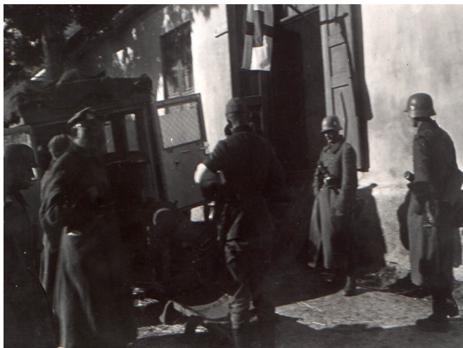
Niemiecki punkt opatrunkowy w Adamowie październik 1939 r.