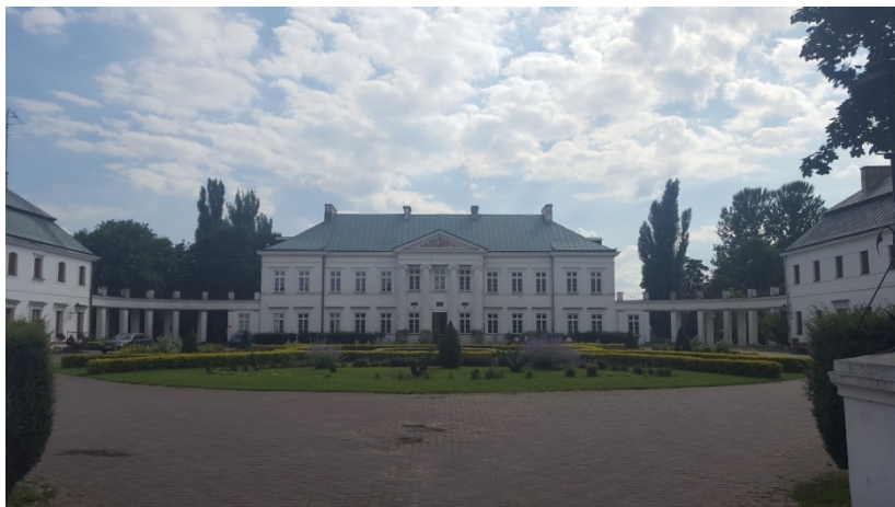
Pałac Jabłonowskich w Kocku - dziedziniec