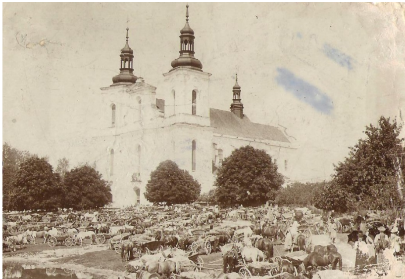
Odpust w Woli Gułowskiej lata 20. XX w. 45

terenach w 1939 r. Będąc wewnątrz Świątyni, warto zwrócić uwagę na wizerunek Chrystusa Ukrzyżowanego, znajdujący się na ołtarzu bocznej kaplicy. Sposób, w jaki jest wykonany, może świadczyć o późnośredniowiecznej architekturze.