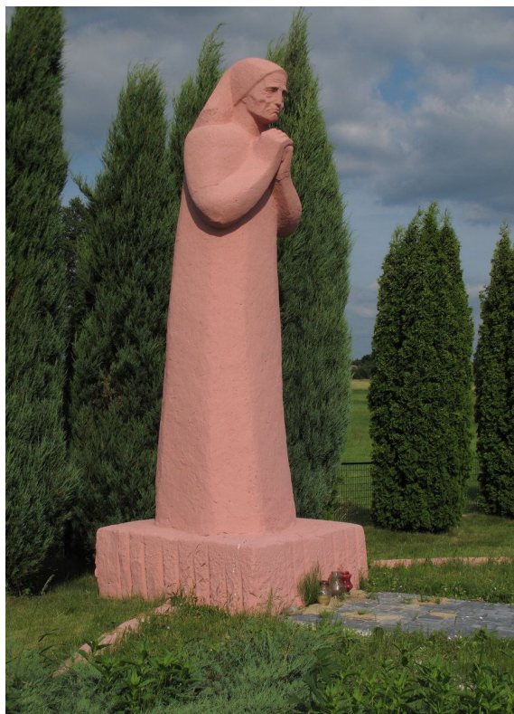
Pomnik w Józefowie Dużym