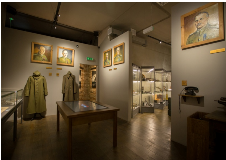
Sala sztabowa Muzeum w Woli Gułowskiej