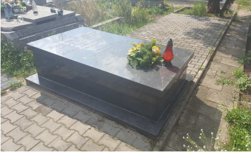
Zbiorowa mogiła żołnierzy SGO „Polesie” w Wojcieszkwie