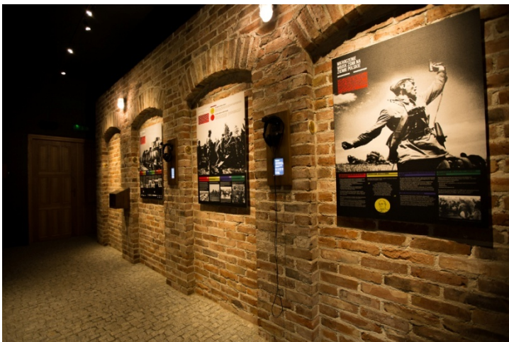
Sala Twierdza Brzeska