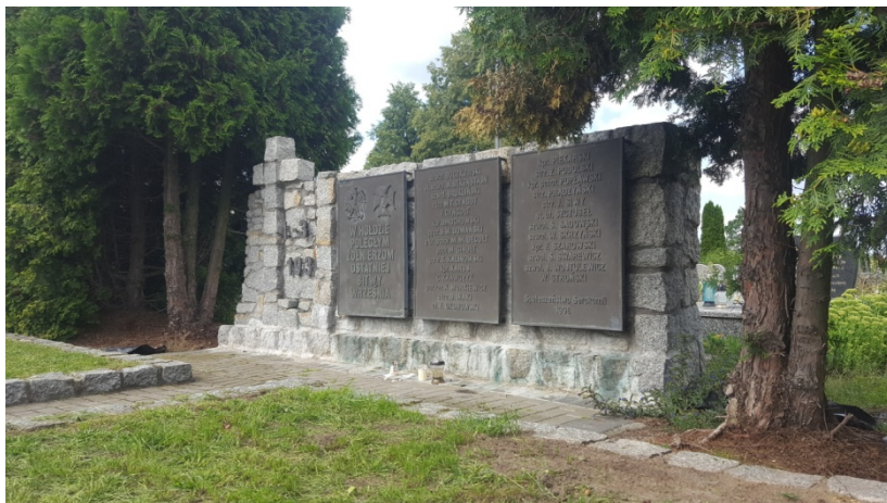
Kwatera kleeberczyków w Serokomli