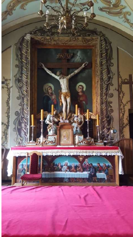
Kaplica Krzyża Świętego