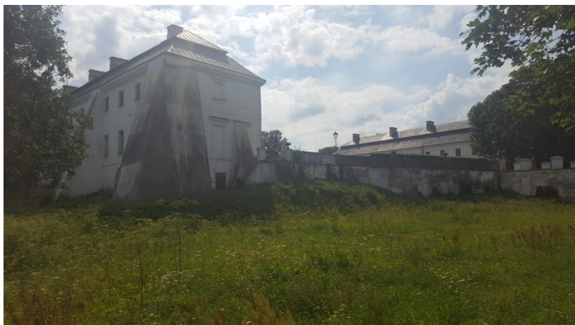
Pałac Jabłonowskich w Kocku - widok od strony wschodniej

Obecnie, mimo znacznych zniszczeń spowodowanych działaniami wojennymi i zaniedbaniami w pierwszych latach po wojnie, zespół pałacowo-parkowy prezentuje się dosyć okazale. Do niedawna mieścił się tu m.in. Dom Kultury i Izba Pamięci Narodowej poświęcona bitwie pod Kockiem, a obecnie - Dom Pomocy Społecznej. Warto wiedzieć, że właśnie w kockim pałacu 6 października 1939 r. gen. brygady Franciszek Kleeberg dowódca Samodzielnej Grupy Operacyjnej „Polesie” dokonał aktu honorowej kapitulacji, kończącego zmagania wojenne polskiego żołnierza w kampanii polskiej 1939 r. Był jedynym polskim generałem, który został przyjęty z honorami przez wojska niemieckie.