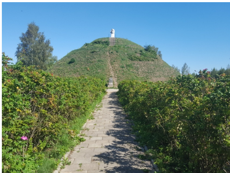
Kopiec H. Sienkiewicza w Okrzei