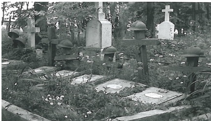
Mogiły żołnierzy SGO „Polesie” w Adamowie. Zdjęcie powojenne 41