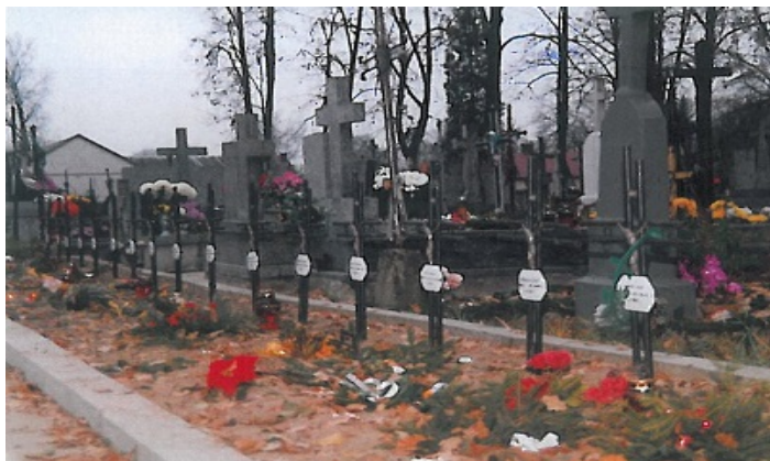
Kwatera kleeberczyków w Adamowie lata 90. XX w. 42