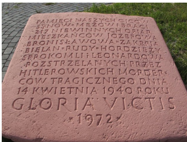
Tablica przy pomniku w Józefowie Dużym