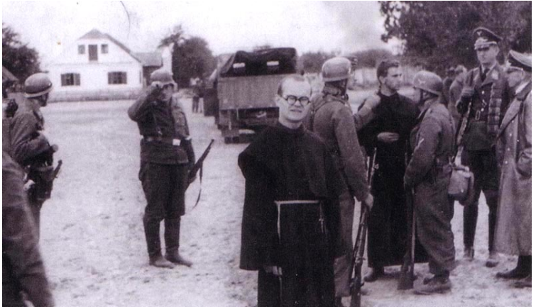
Zakonnicy z Woli Gułowskiej w rozmowie z niemieckim oficerem 55

Pogrzeb żołnierzy niemieckich odbył się w Dęblinie, natomiast niektórzy z poległych Polaków spoczywają razem z żołnierzami generała Kleeberga na cmentarzu w Turzystwie.