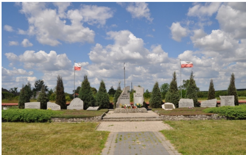
Kwatera poległych żołnierzy SGO „Polesie”