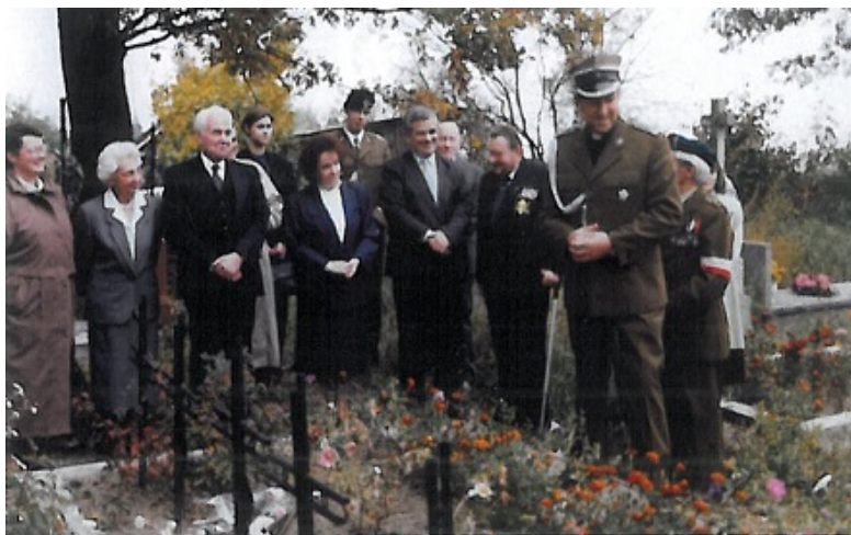
Ostatni Prezydent RP na uchodźctwie Ryszard Kaczorowski na grobach kleeberczyków w Adamowie (1996 r.) 43