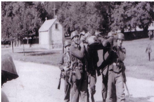
Niemieccy żołnierze, niosą swojego kolegę. Wola Gułowska

W wyniku starcia w Woli Gułowskiej Niemcy stracili 21 żołnierzy (8 zabitych i 13 rannych). Straty polskie są trudne do oszacowania i prawdopodobnie wyniosły 17 zabitych, 35 rannych i ok. 200 wziętych do niewoli. W boju poległo dwóch dowódców baterii, a dowódca dywizjonu kapitan Zbigniew Bolesław Mokrzycki w wyniku odniesionych ran zmarł po 6 dniach. 53